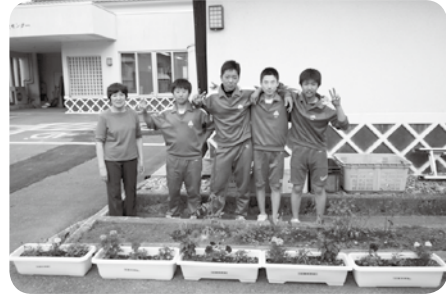
山都中学校のみなさん。