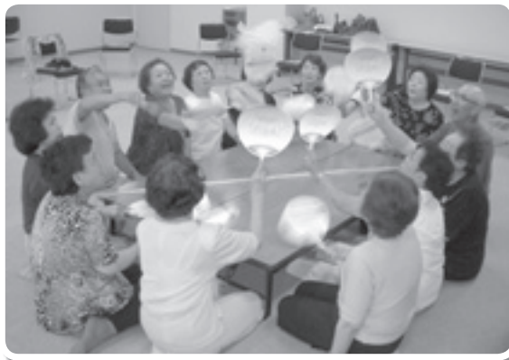
サロンでゲームを楽しむ