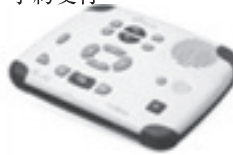
CD図書再生機「プレクストーク」