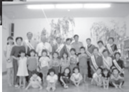
荻野保育所のみなさんと

犯罪や非行防止にかかわら ず、明るい社会を築くためには、 地域の皆様の理解と協力が必要 不可欠です。地域が一体となり しあわせな町づくりに取り組ん で頂きますよう、お願いいたし ます。