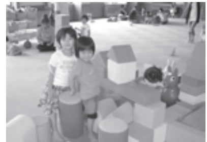
子育て支援事業 おもちゃ図書館