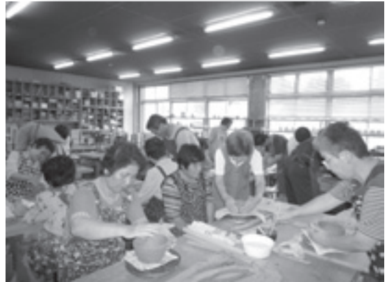
作品づくりに取り組む会員

山都町陶芸教室では8月31日（月）喜多方市高齢者生産活動センターの協力を得て、陶芸の基本を一からご指導をいただきました。 会員が一堂に会しての研修を、年に数回実施しております。 会員相互の交流や親睦をはかりながら、たのしく仲間づくりをしております。 陶芸教室では随時、会員募集しております。