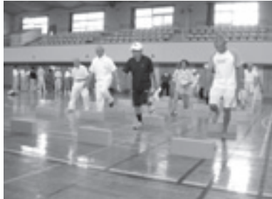
老人クラブ体力測定