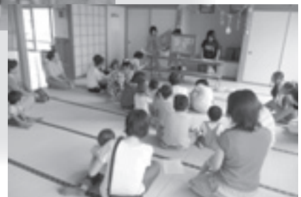
紙芝居の読み聞かせ

塩川支所では、幼少期からのボランティア体験によって「福祉の心」を育むことを目的とし、夏休みを利用したサマーショートボランティアスクールを開催しました。 塩川デイサービスセンターでは、介護のお手伝いをし、デイサービス夏祭りイベントにも参加しました。元気な子供たちに利用者の皆さんも目を細め、大変喜んでおりました。