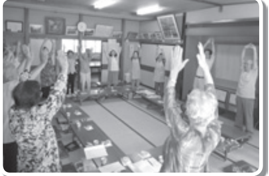
介護体操を全員で