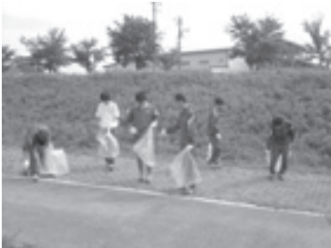
ボランティア協力校による清掃活動