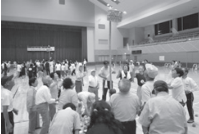
勝利めざし、がんばりました！

8月28日(金)押切川公園 体育館で、体育指導委員・民 生児童委員障がい者福祉部会 の皆様の協力のもと、身体障 がい者福祉協会支部会員と市 内作業所の利用者及び関係者 約160名で和やかに開催されま した。支部会員・作業所利用 者對抗綱引きでは、両者一歩 も譲らず白熱した展開となり ました。他に障がい区分ごと の個人競技や、地区ごとの分 会對抗団体種目など多彩な競